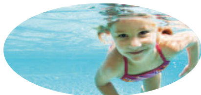
Benjamin Bohn Bürgermeister