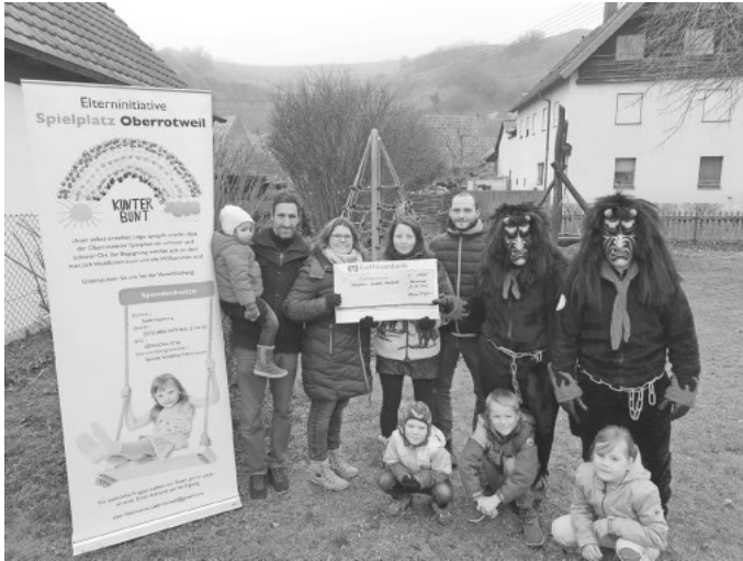
Alemanne Teufel e.V. Vogtsburg

Wir freuen uns auch weiterhin die Gemeinde als Verein zu unterstützen.