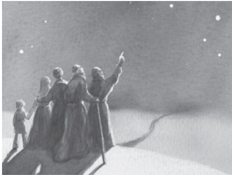
Kommt und seht