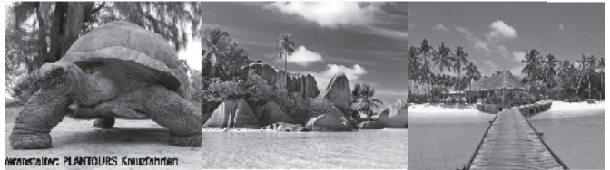
veranstalter: PLANTOURS Kreuzfahrten

Bordguthaben € 50,- pro Person Kombi-Ersparnis mit der Anschlusskreuzfahrt Madagaskar & Mauritius sparen Sie € 1.300,-