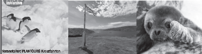
Veranstalter: PLANTOURS Kreuzfahrten